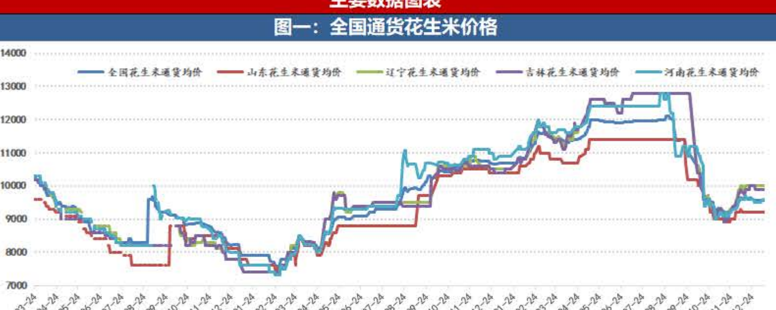
图一: 全国通货花生米价格